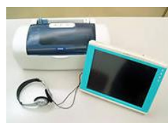
もの忘れ相談プログラム