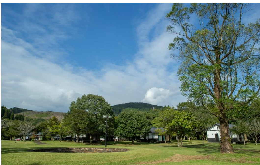
川原自然公園（木城町）