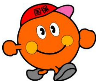
宮崎県国民健康保険 イメージキャラクター 「オレンジくん」