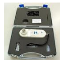
マイクロ CO モニター