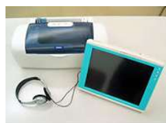
もの忘れ相談プログラム